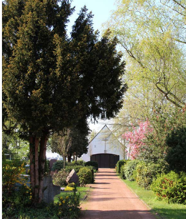
Friedhof Kaiserswerth, Foto: S. Hertel