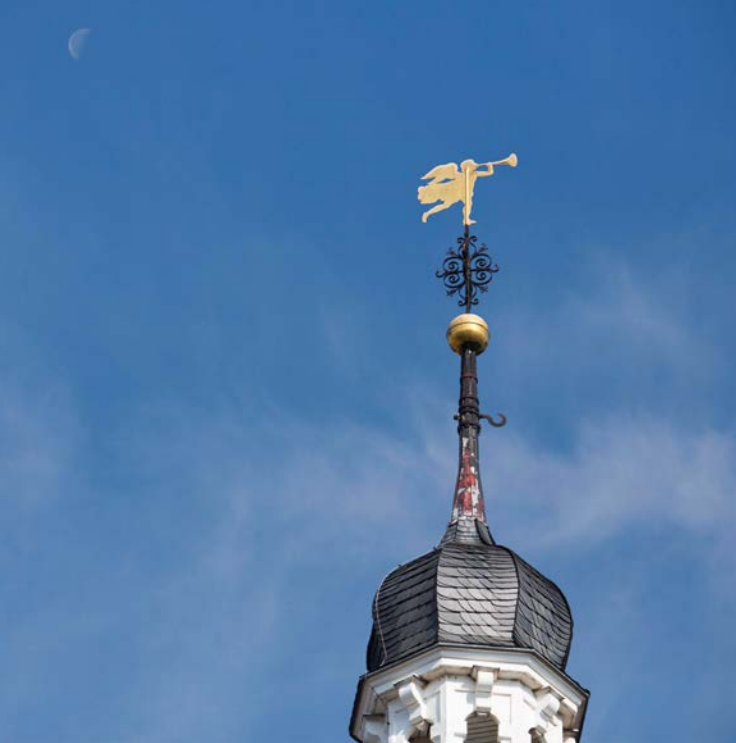
Evangelische Neanderkirche, Foto: evdus