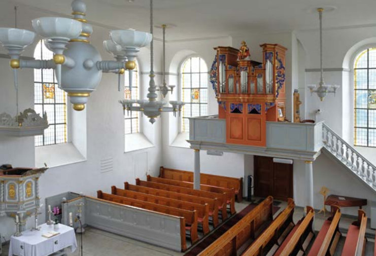
Schöler Orgel, Evangelische Kirche Urdenbach, Foto: S. Lepke